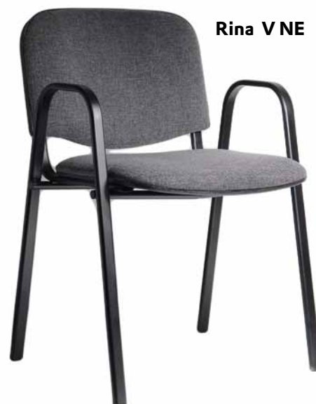
Rina V NE