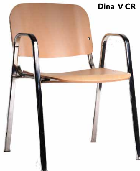
Dina V CR