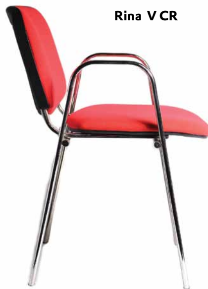
Rina V CR